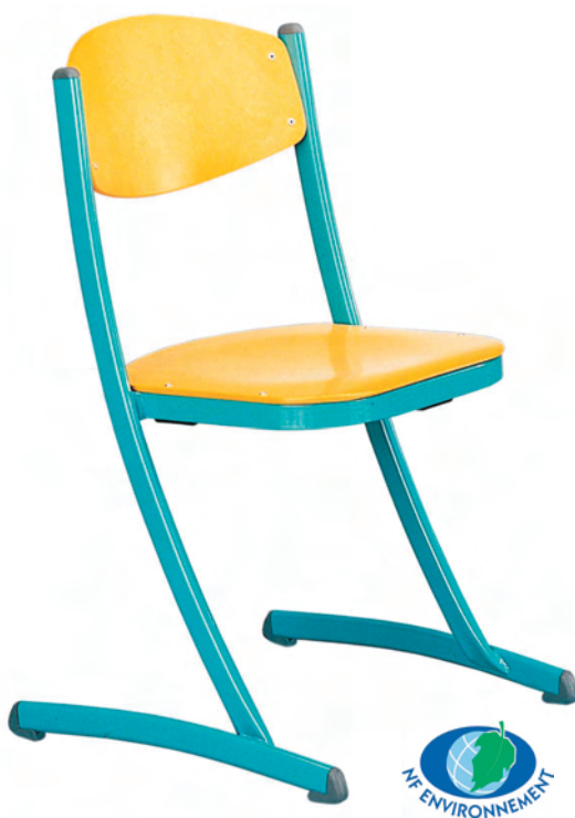
Chaise Théorème 2

Chaise à structure métallique avec appui sur table & empilable.