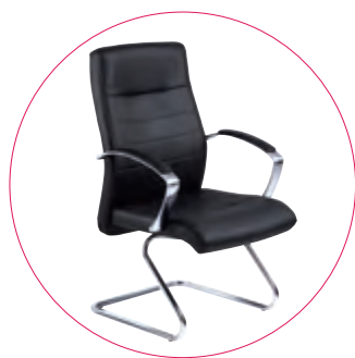
Visiteur Structure luge en tube d'acier chromé rond Ø 25 mm. Vachette croûte de cuir noir ou tissu taupe.