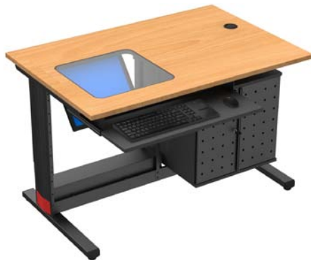
F128SCT + FHHP