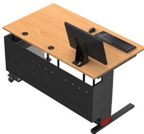
F148DC + FF + FU