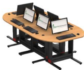
Table de réunion avec plateau demi-lune 140x70 cm

Îlot de 4, 5, 6 ou 8 places avec plateaux de liaison