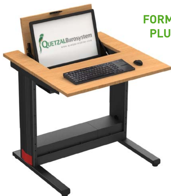
TABLE POUR ÉCRAN ESCAMOTABLE

Intégration des écrans jusqu'à 24" de largeur 565 mm. (Voir précision dans le tarif) L'écran fixé sous le volet pivotant, disparaît en position fermée et dégage entièrement le plan de travail. Ce qui assure la polyvalence de la table, le travail est possible avec ou sans l'informatique devenue invisible. L'ouverture par pression sur le volet est assistée par deux ressorts à gaz testés 30 000 ouvertures.