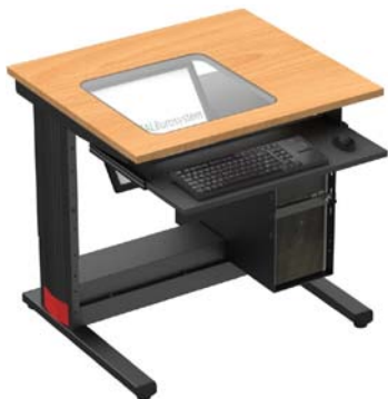
F87SCT + FWB