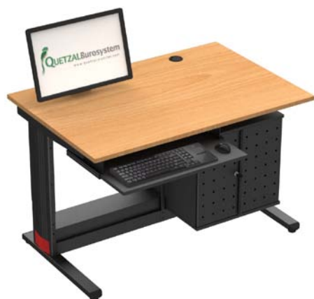
F128DC + FT + FHHP