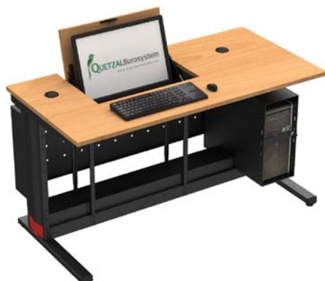
F147E22C + VVB + FF