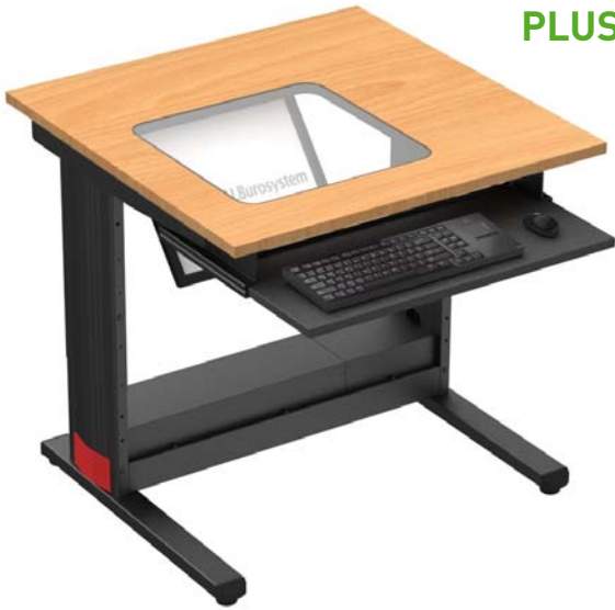
TABLE POUR ÉCRAN ENCASTRÉ SOUS UNE DALLE DE VERRE

Le plan de travail est entièrement dégagé pour y disposer les documents. Fixé sous le plateau sur une platine métallique VESA inclinée, l'écran est visible sous une dalle en verre trempé de 5 mm d'épaisseur affleurant le plateau. Ce qui assure la polyvalence de la table, le travail est possible avec ou sans l'informatique.